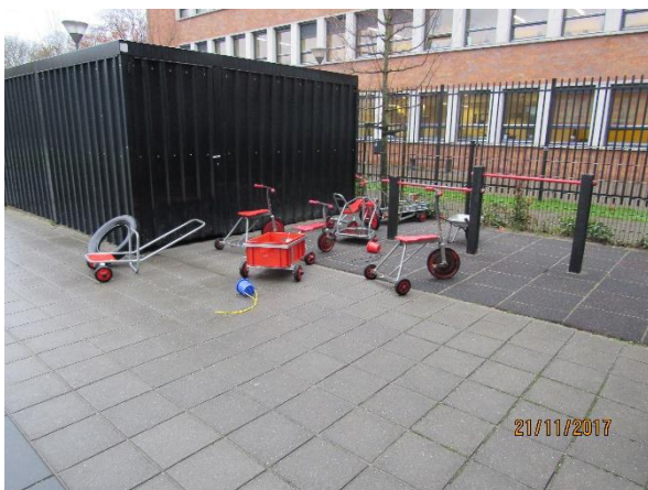
Locatie Prof. Waterinklaan